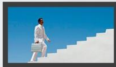
Ваш личный рост